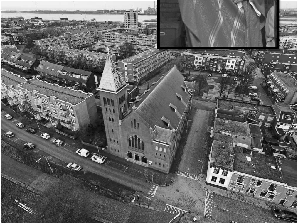
foto genomen met een drone, en nu via facebook in ons Kruispunt.

Sinds een jaar is onze kerk op zaterdagmiddag van 14.00 tot 17.00 uur open voor iedereen die binnen wil komen. Er staat een banner buiten en we proberen de kerk zo uitnodigend mogelijk open te stellen. Is er veel belangstelling? Dat verschilt, soms komen er een paar mensen, soms een stuk of 12. Ook komen er mensen een kaarsje aansteken! Het gebeurt ook dat er niemand komt! Af en toe zijn er activiteiten op de zaterdagmiddag activiteiten, zoals de Walk of Peace die bij ons kwam knutselen en zingen. In december oefende het kerstgelegenheidskoor om 16.00 uur, was er de kerststallen tentoonstelling enz.