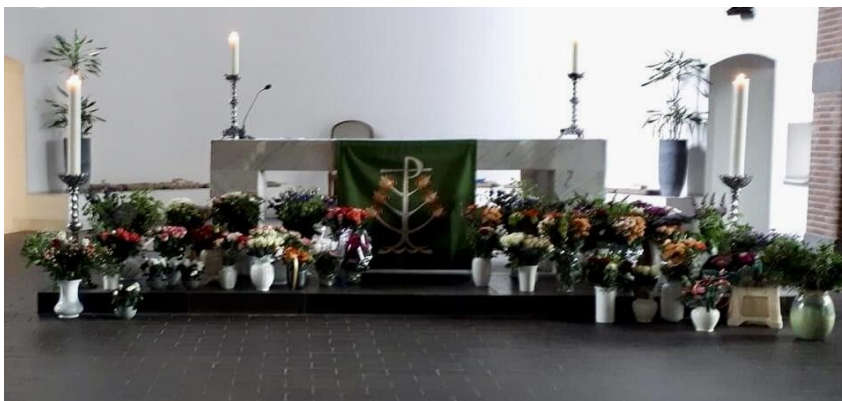
Bloemen- en dankdienst 2021