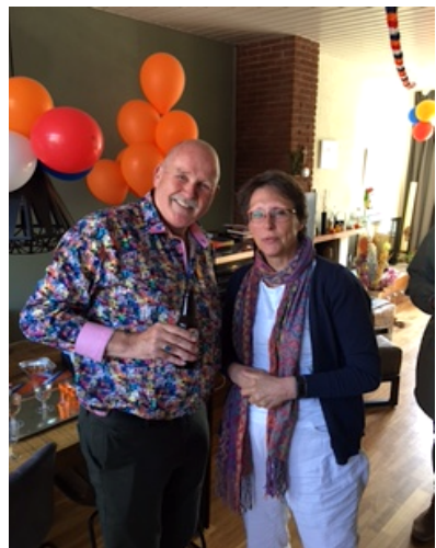
De decorandus en de aanvraagster