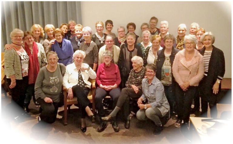
1Foto bij het 50 jarig jubileum van Aktiva

We gaan ervan uit dat corona dit seizoen geen roet in het eten gaat gooien en dat we een fijn en gezellig seizoen met elkaar gaan hebben.